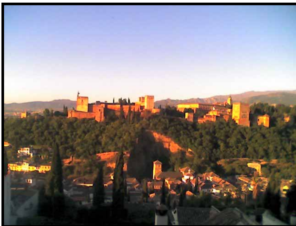
Teléfono móvil. Maio de 2005